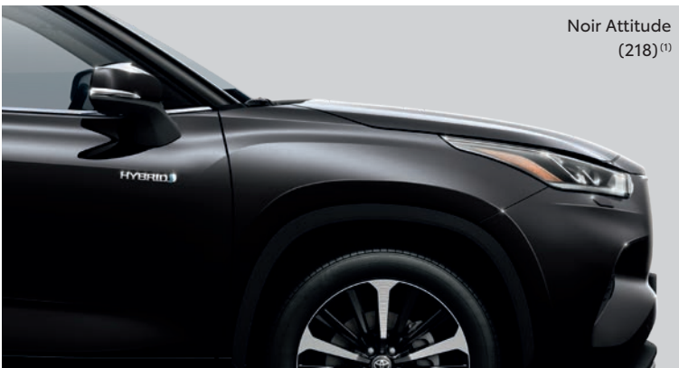
Noir Attitude (218) (1)