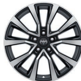
JANTES EN ALLIAGE 18"

En plastique antidérapant avec bords surélevés, il stabilise la position de vos bagages, tout en protégeant la moquette de votre coffre.