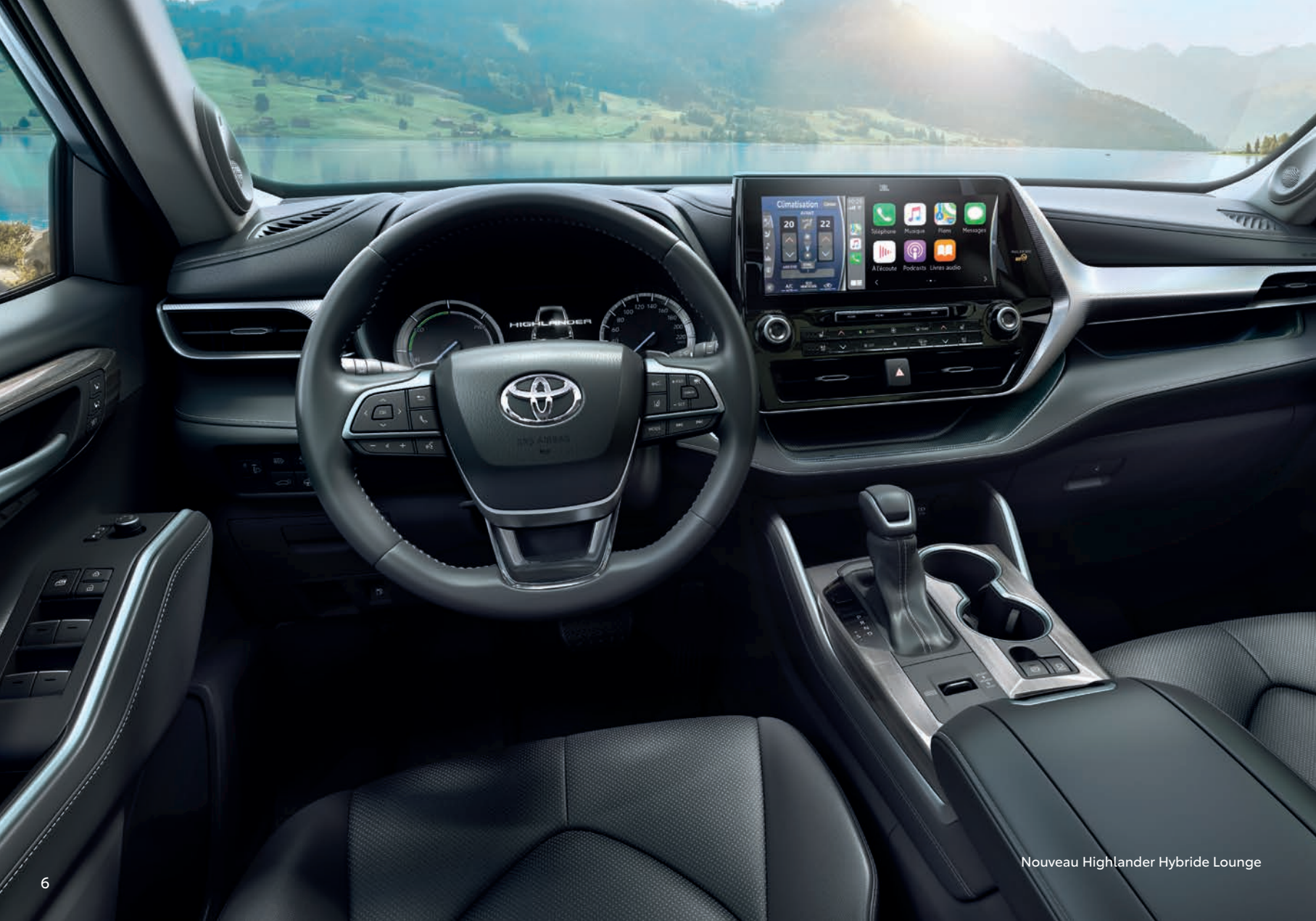
Nouveau Highlander Hybride Lounge