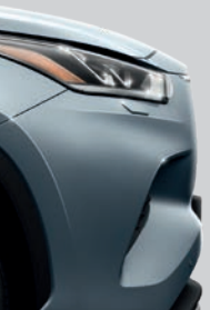
Bleu Horizon (1K5) (2)