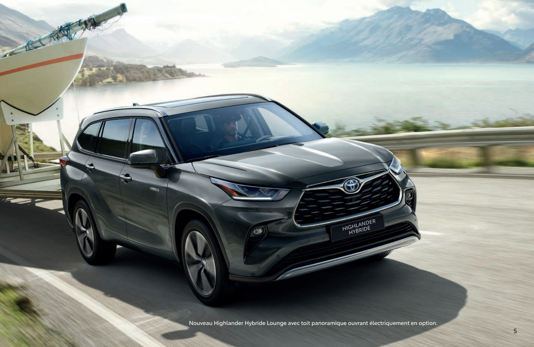
Nouveau Highlander Hybride Lounge avec toit panoramique ouvrant électriquement en option.