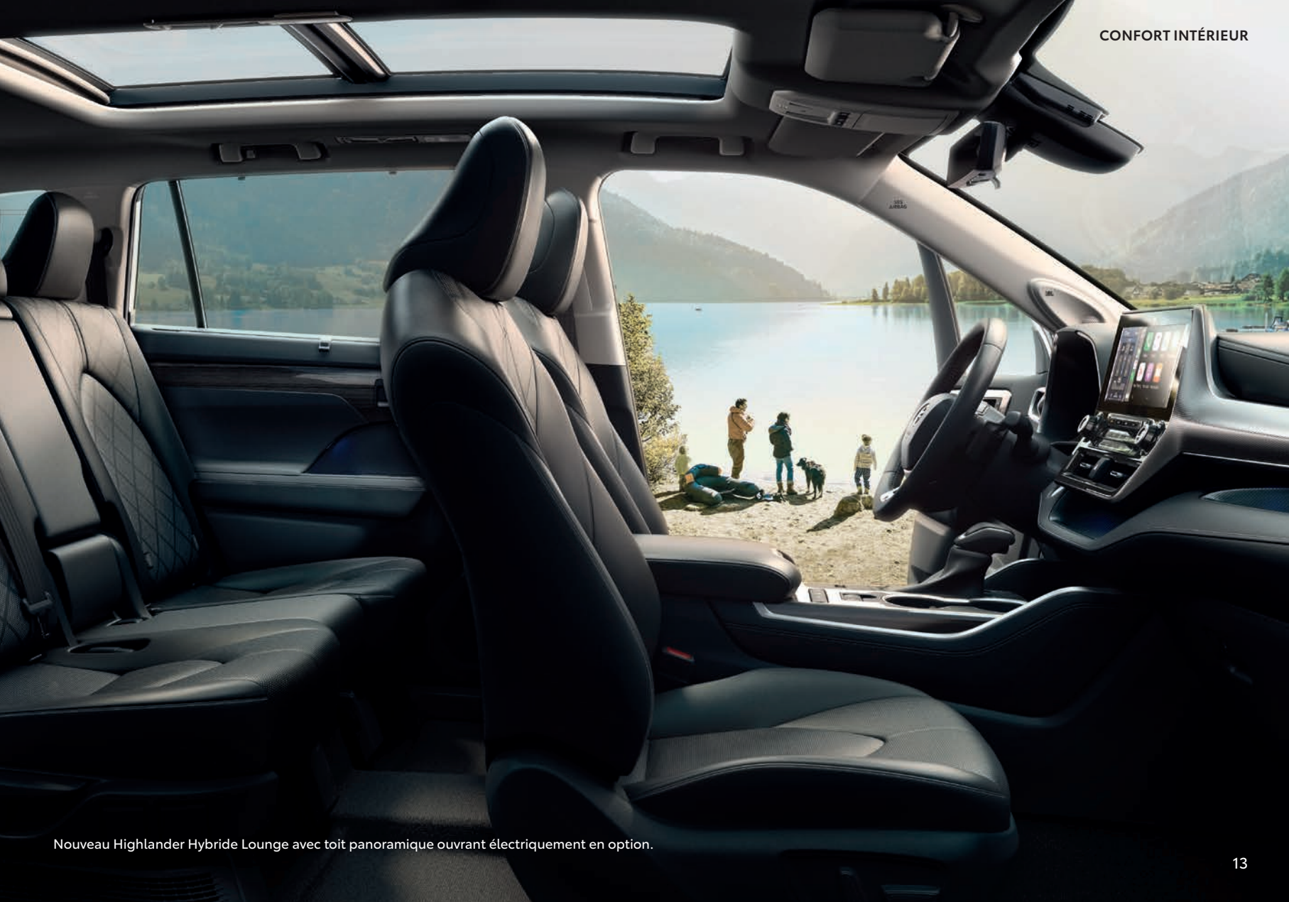
Nouveau Highlander Hybride Lounge avec toit panoramique ouvrant électriquement en option.