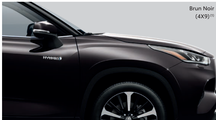
Brun Noir (4X9) (1)