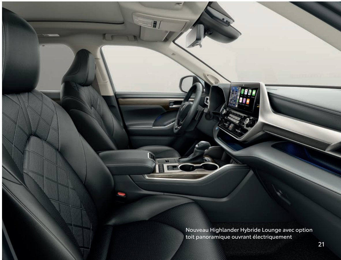
Nouveau Highlander Hybride Lounge avec option toit panoramique ouvrant électriquement