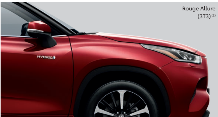
Rouge Allure (3T3) (2)